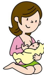
การดูแลมารดาหลังคลอด

ระยะเวลาให้บริการ : ไม่เกิน 1 ชั่วโมงต่อครั้ง