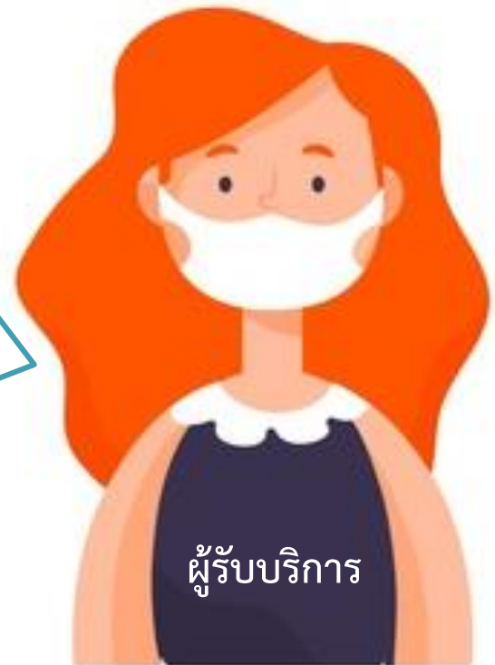
ผู้รับบริการ