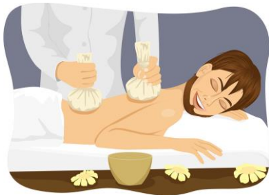
การประคบสมุนไพรเพื่อการรักษา