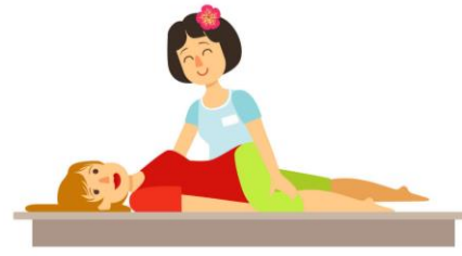
การนวดไทยเพื่อการรักษา