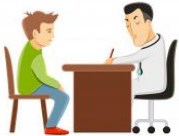
การตรวจวินิจฉัยโรค