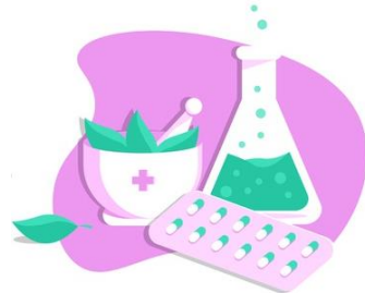
การจ่ายยาสมุนไพร